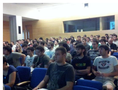
Figura 1: Instantes de la primera parte de la visita