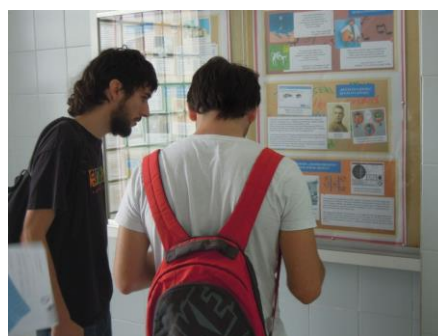
Figura 2: Visita autoguiada mediante el cuestionario

A continuación se muestran las cuestiones que integran uno de los cuatro cuestionarios que se facilitaron a los alumnos para responder durante el recorrido a lo largo de la exposición permanente del museo: