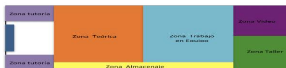
Figura 3: distribución teórica del aula PBES.

Para facilitar ambas cosas (trabajo autónomo de los equipo de estudiantes y compartición del aula por parte de más de un profesor), se diseñó un aula especial, llamada “aula PBES”, dotada de distintos espacios capaces de ser utilizados de distintas formas. El esquema del aula se puede ver en la figura 3.