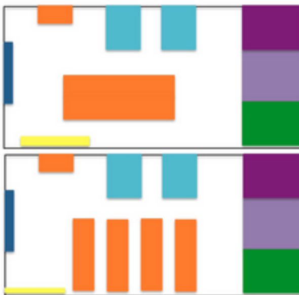
Figura 5. Dos configuraciones concretas del aula PBES (mismo código de colores que el la figura 3).

Con el equipamiento mencionado el aula PBES se puede configurar de varias formas, de forma ágil, para cumplir distintos cometidos. En la figura 5 se ilustran dos configuraciones concretas utilizadas en dicho aula.