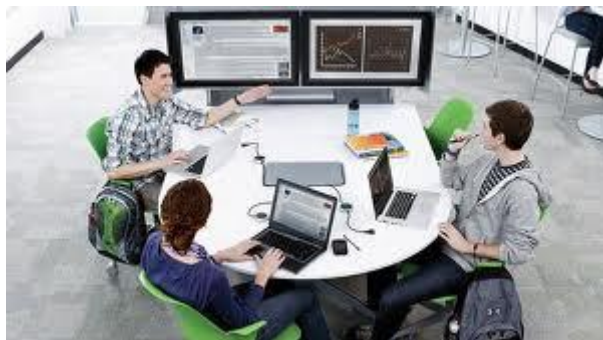
Figura 4: Mesa utilizada en la zona de trabajo en equipo y en la zona de tutorías.

tutorías entre un docente y uno o varios estudiantes (figura 4, arriba). Está equipada de mesas y bancos que permiten mayor proximidad entre docente y estudiante que una mesa convencional de aula o de despacho. Además, el profesor puede resolver dudas a un único estudiante o a un equipo completo, formado por cuatro o cinco estudiantes.