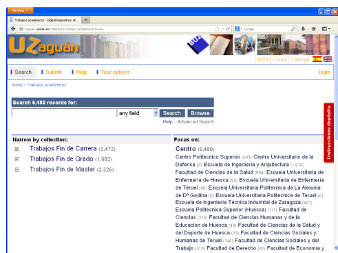
Figura 1: Portal Zaguán de la Universidad de Zaragoza.

bas. La Tabla 1 muestra el conjunto de hitos de entrega de información/datos por parte de los profesores y de resultados por parte de los alumnos. Puede observarse que esta planificación llega hasta la semana 20. Esto es debido a que se cuentan las semanas de vacaciones del primer cuatrimestre, y a que se ha decidido que la última tarea se entregue al finalizar el periodo de exámenes, en vez de al principio.