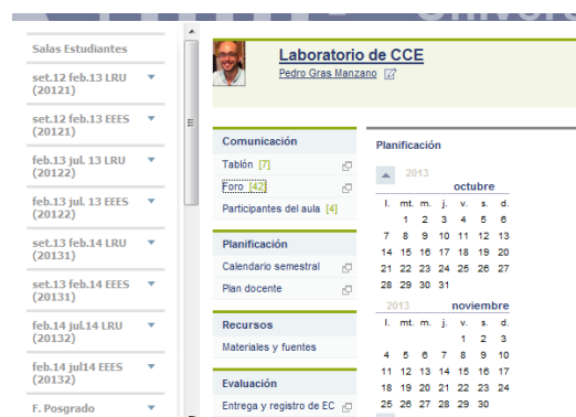
Figura 1: Laboratorio virtual de CCE.

Siguiendo con el ejemplo anterior, la Figura 1 muestra la imagen del laboratorio virtual de competencia comunicativa escrita (Laboratorio CCE) que hemos incorporado como complemento a algunas asignaturas del plan de estudios en las que se realizan actividades donde hay que redactar documentos o textos ya de una cierta envergadura.