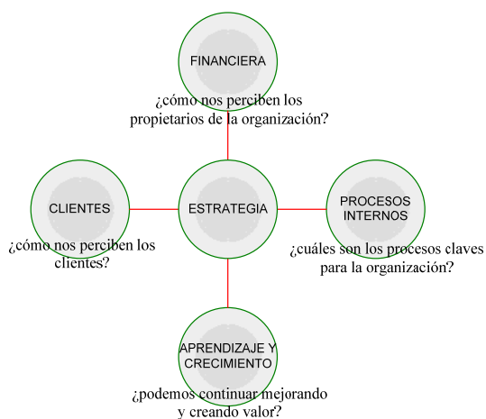
Figura 1. Perspectivas del CMI

El conjunto de indicadores que lo comprenden se clasifica en cuatro perspectivas, la financiera, la de clientes, la de procesos internos y la de aprendizaje y desarrollo, como se puede ver en la Figura 1.