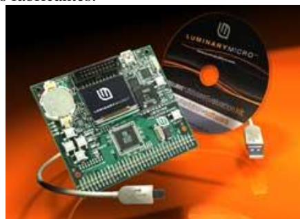
Figura 1: Kit de desarrollo LM3S1968

Para desarrollar la mayoría de los contenidos prácticos de la asignatura y el proyecto que abordamos en detalle en este documento, se le proporciona al alumno un kit de desarrollo basado en el microcontrolador de Luminary (actualmente adquirida por Texas Instruments) LM3S1968 [6]. Dicho kit de desarrollo consta del procesador anteriormente mencionado, además de una gran variedad de dispositivos periféricos. Entre estos dispositivos podemos remarcar, como el más atractivo para el alumno, un display OLED de 128x96 píxeles, con 16 niveles de grises. También consta de varios pulsadores, un pequeño altavoz, que puede controlarse mediante un PWM, una pila para alimentar un reloj de tiempo real integrado dentro del microcontrolador, y un conector de dos filas donde puede accederse a todos los puertos del microcontrolador, para conectar dispositivos periféricos externos (ADCs, I2C, SPI, etc). Mediante la programación de la variedad de periféricos que aporta este kit de desarrollo pretendemos dotar al alumnado de la capacidad de conocer e integrar las distintas técnicas para gestionar dichos periféricos. Esta habilidad es extrapolable a otros sistemas basados en microcontroladores de la misma familia o de otros fabricantes.